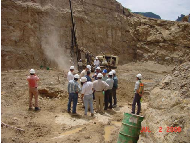
Puente Baluarte Excavación apoyo 5, Margen Durango.