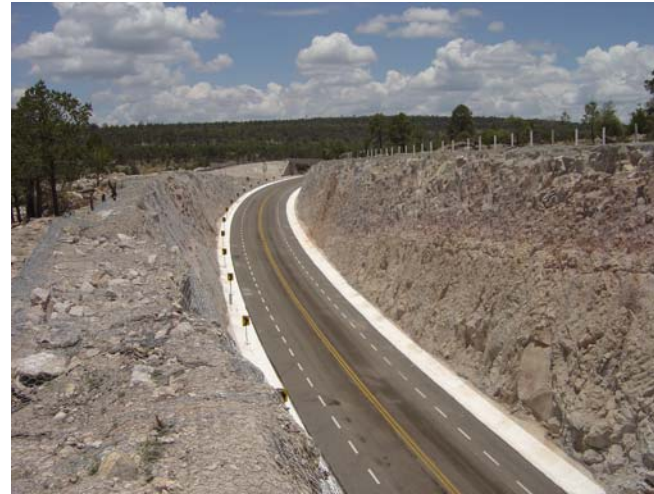
Carr: Durango-Mazatlán, Subtr: Lib. Durango-Otinapa