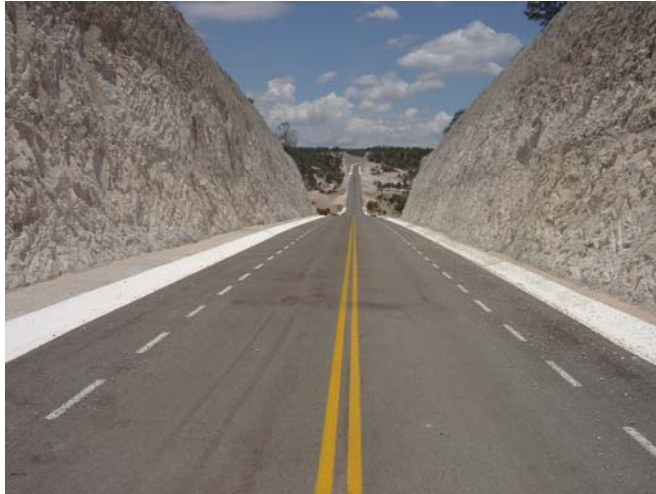
Carr: Durango-Mazatlán, Subtr: Lib. Durango-Otinapa