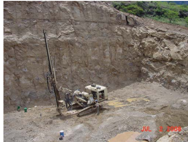
Puente Baluarte Excavación concluida al 100% del apoyo 5 Margen Durango.