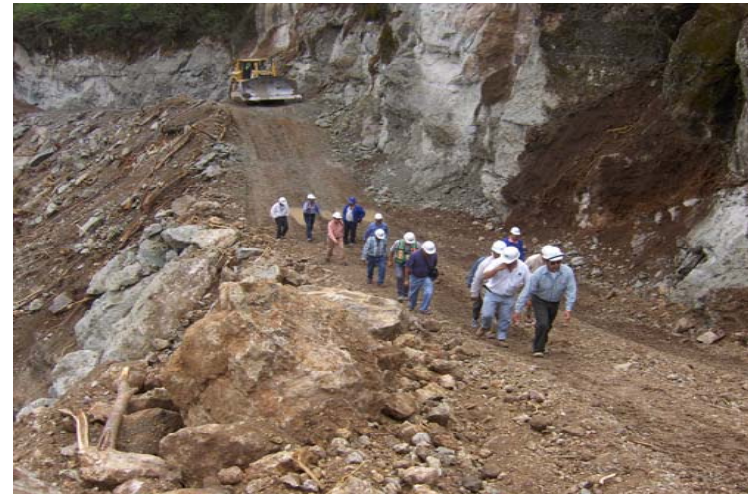
Puente Baluarte Camino de acceso para el apoyo 6, 7 y 8, Margen Sinaloa.