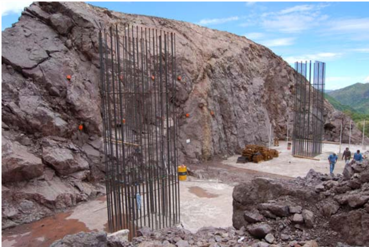
Puente Baluarte Zapata terminada apoyo 12, Margen Sinaloa.