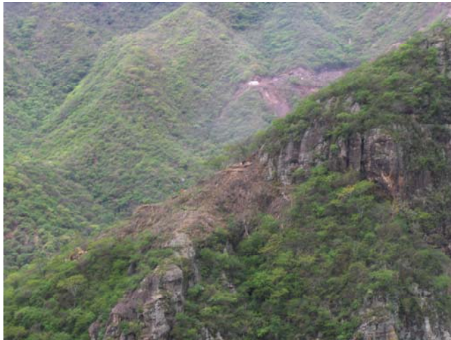
Puente Baluarte Inicio de excavación apoyo 6, Margen Sinaloa.