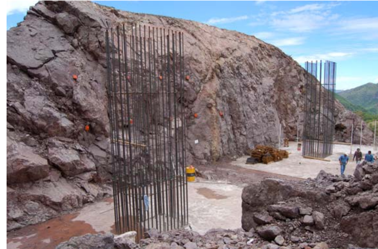
Puente Baluarte Zapata terminada apoyo 12, Margen Sinaloa.