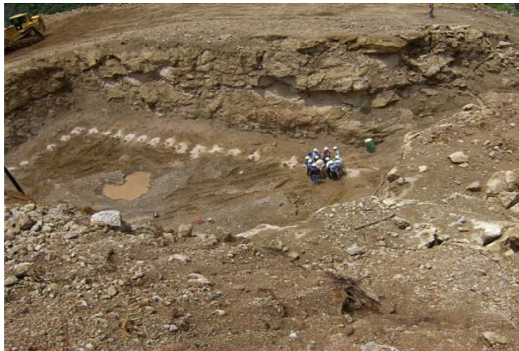
Puente Baluarte Excavación en proceso apoyo 5, Margen Durango.