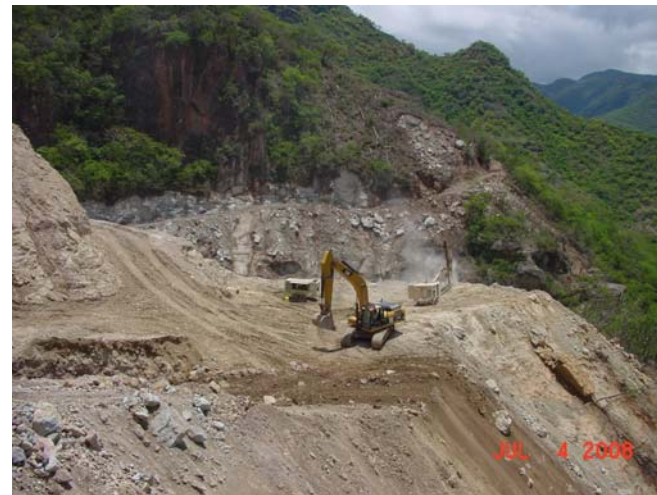
Puente Baluarte Excavación apoyo 10 y camino de acceso para apoyo 6, Margen Sinaloa.