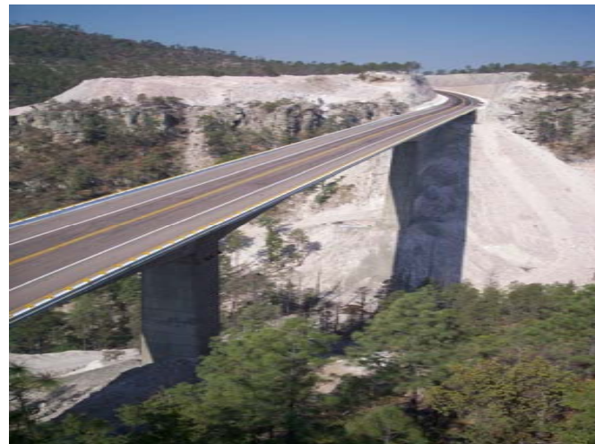
Carr: Durango-Mazatlán, Subtr: Otinapa- El Salto "Puente La Pinta"