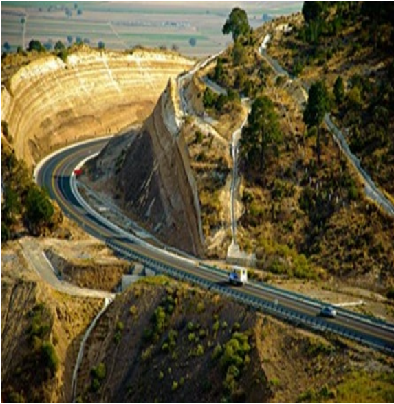
Autopista Amozoc-Perote. México 5

Para lo cual se modificaron los Anexos 7.- “Mecanismos para distribuir los ingresos netos residuales de la Vía Concesionada y el Libramiento de Perote, entre la Concesionaria y el FIN-FRA” y 10.- “Bases de Regulación Tarifaria” y además se incluyó el Anexo denominado “Modelo Financiero”, en ese sentido se realizó la Segunda Modificación al Título de Concesión de la Autopista Amozoc-Perote.