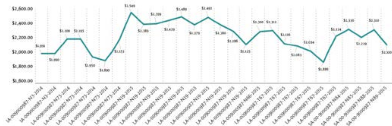
Imagen 7. Costos unitarios por televisor

“El Programa TDT implicó un importante incremento en la demanda de televisiones digitales en México durante los años 2014 y 2015”