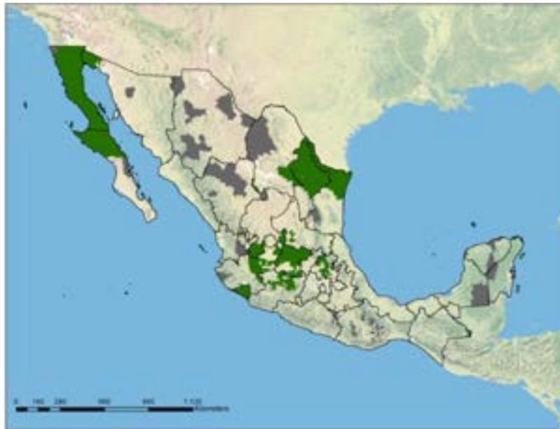
Imagen 2. Municipios donde se entregaron televisores a Diciembre de 2014

“ A fecha 31 de diciembre de 2015 se habían entregado el 97% del total de televisores comprometidos en el proyecto ”