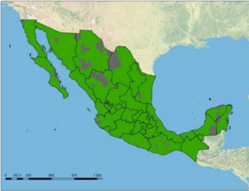
Imagen 1. Municipios donde se entregaron televisores al 31 de diciembre de 2015