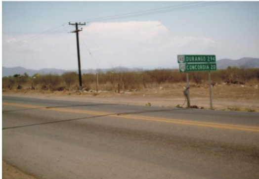
FOTO No: 124 (DESCRIPCIÓN) VISTA HACIA: GENERAL A1 = 2.50 m. C1 = 3.50 m. C2 = 3.50 m. A2 = 2.50 m.

NUMERO DE ESTACIÓN: 28023 CARRETERA: CD. VICTORIA-MATAMOROS km. DE INSTALACIÓN APTO. 99+500 FOTO No: 123 (DESCRIPCIÓN) VISTA HACIA: MATAMOROS