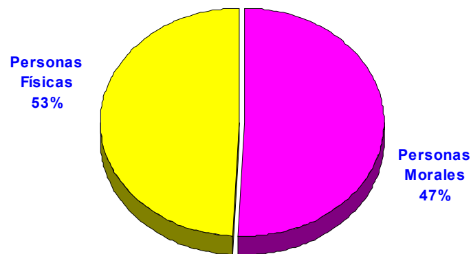
Flota Vehicular por Personas Morales y Personas Físicas