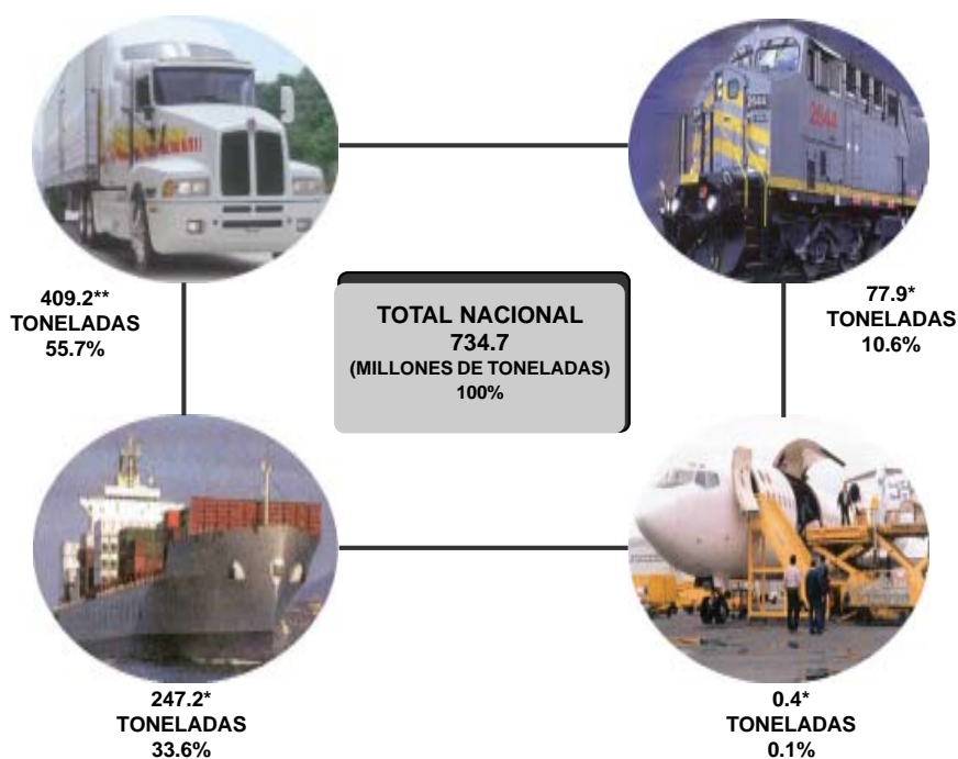
TONELADAS TRANSPORTADAS POR MODO DE TRANSPORTE (MILLONES DE TONELADAS)