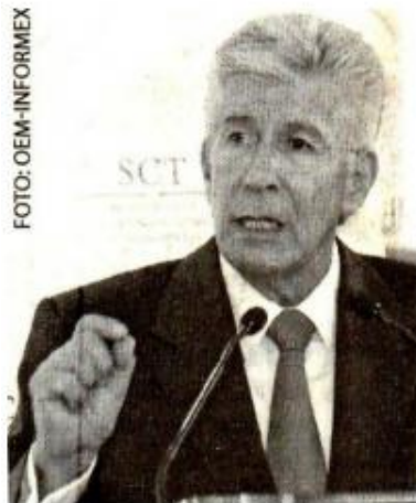
GERARDO RUIZ Esparza, secretario de Comunicaciones y Transportes.